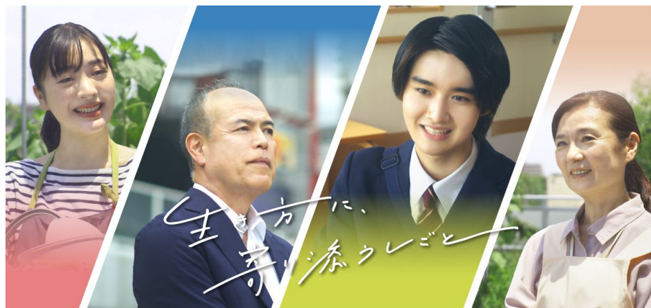
SPECIAL MOVIE 公開中 介護のしごと