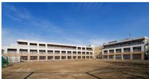
学校を改修して整備した事例