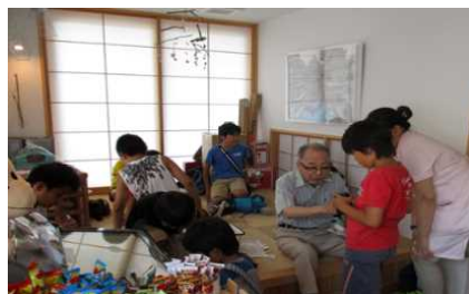
地域交流施設のイメージ