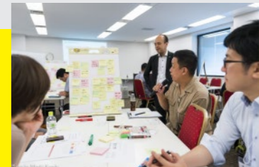
※昨年のプログラム時の様子です。今年はオンライン開催になります。