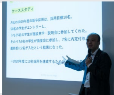
※昨年のプログラム時の様子です。今年はオンライン開催になります。