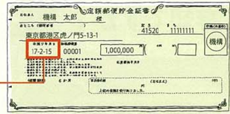
定額郵便貯金証書（例）